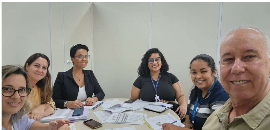
Reunião Técnica – 23/06/2023