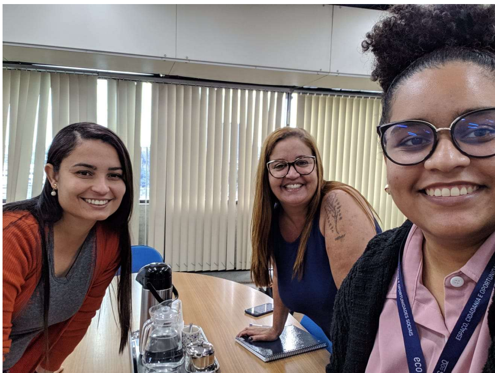
Reunião Técnica – 19/06/2023