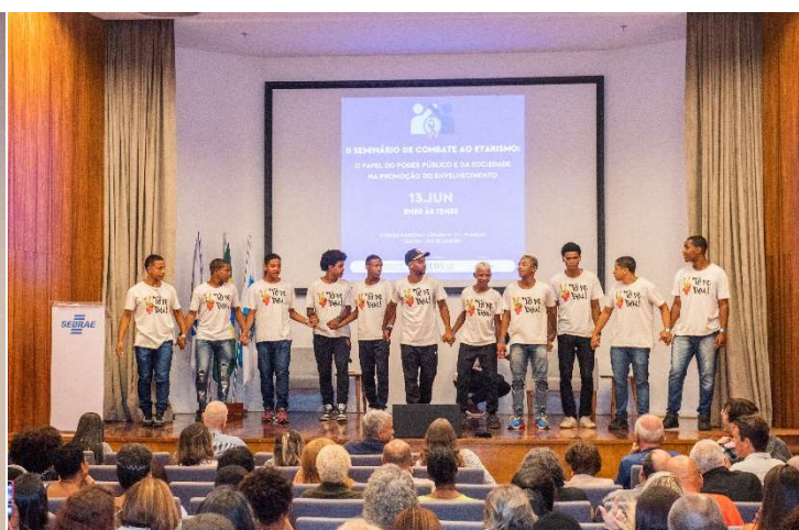
Registros fotográficos do seminário – 13/06/2023