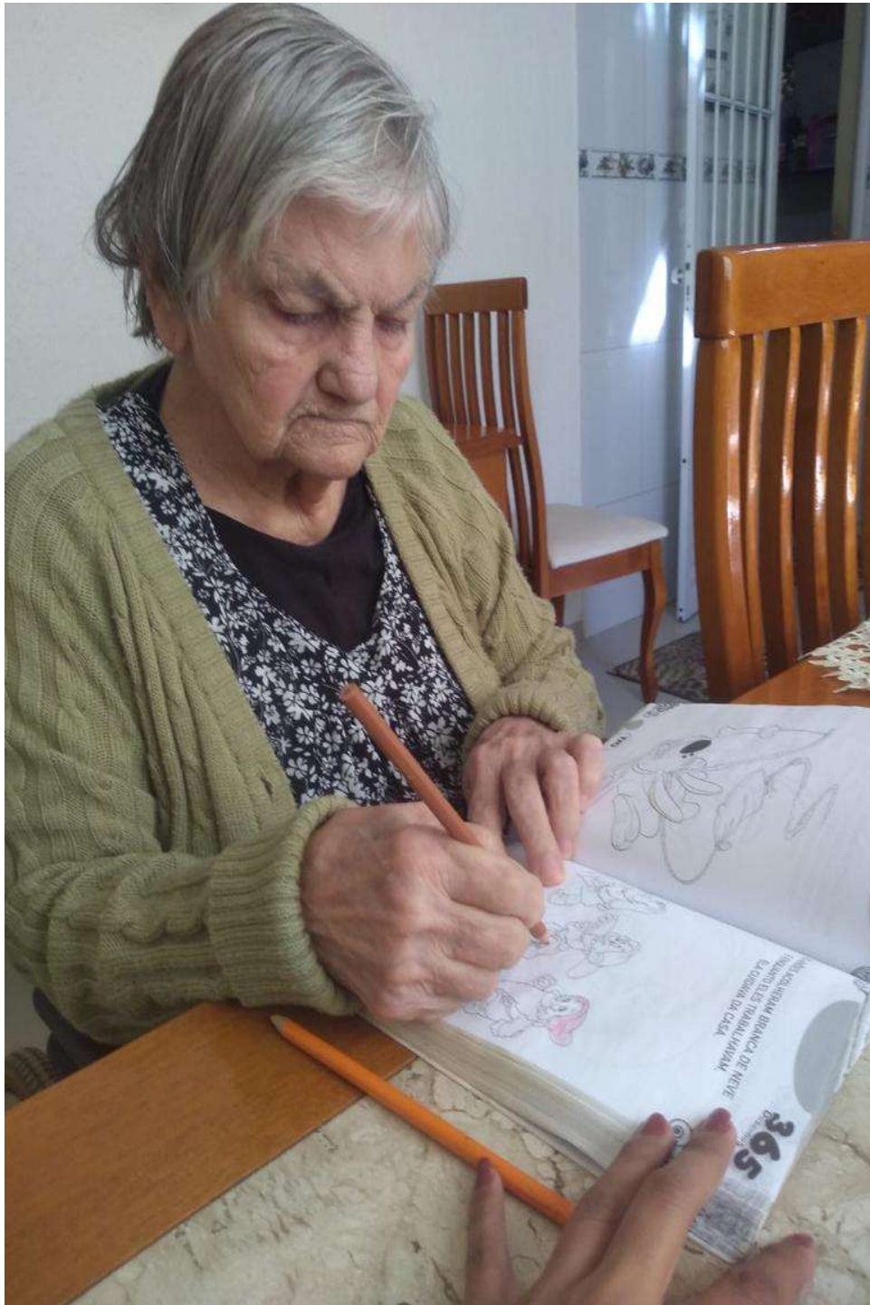
Execução do serviço em junho: estímulo cognitivo