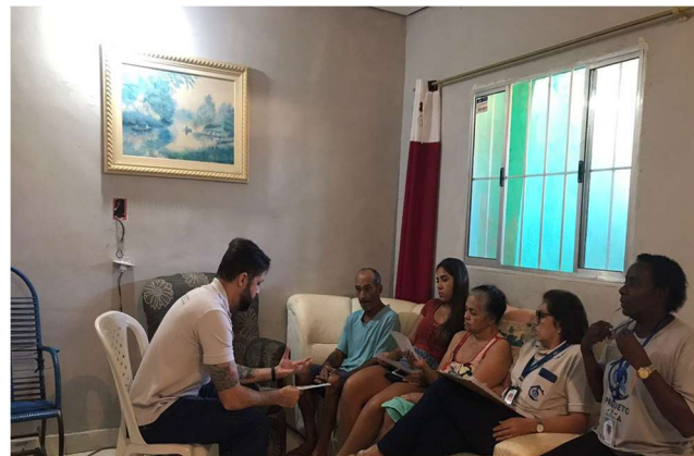
Oficinas sobre Pirâmide alimentar -24/04/23