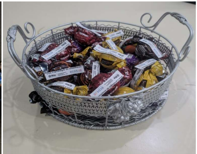
Capacitação profissional ECOS - 25/04/23